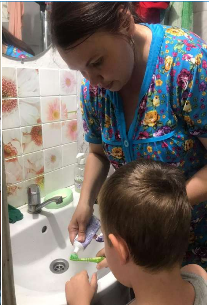
СРЕДНЯЯ ГРУППА «ВАСИЛЕК»